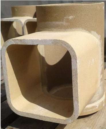
T-PIECE with bottom ceramic plate DN160