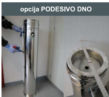
opcija PODESIVO DNO

Pre početka montaže proveriti visinu priključka za ložišta. Visina se određuje osno u odnosu na cev priključka.