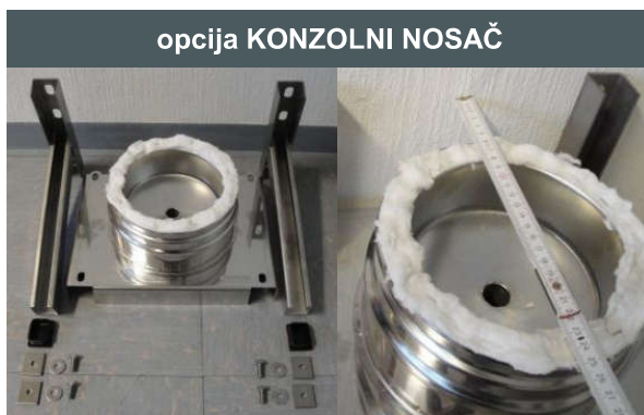
opcija KONZOLNI NOSAČ

Odredite visinu podesivog dna (potrebna visina do priključka) i isecite višak. Nakon toga odredite potrebnu udaljenost dimnjaka od zida (u odnosu na zidni držač)