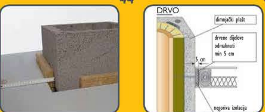
44 Otvor na ploči mora biti kod svih stranica za 3 cm veći od plašta.