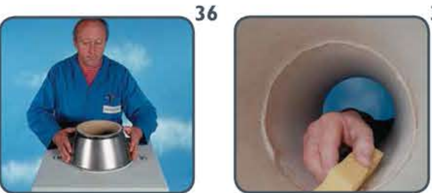
36 Namjestite cijev i na gornji rub nanosite brtvenu pastu. Pritisnite konus do ruba završne ploče.