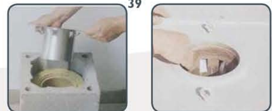
39 Postavite dilatacijsku rozetu.