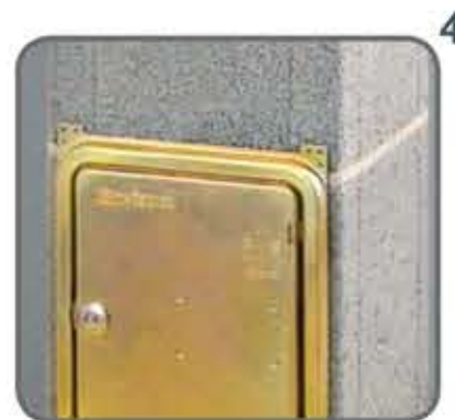
48 Nakon montaže vratašca dimnjak možete ožbukati.