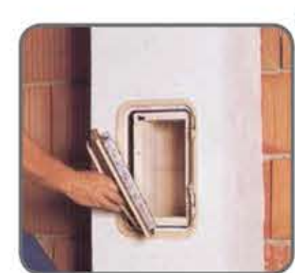
49 Kad je dimnjak ožbukun, postavite unutarnji uložak dimnjačkih vratašca.