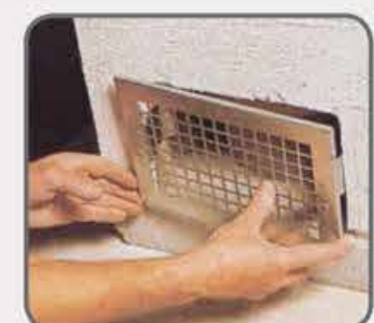
52 U izrezani otvor na prvom plaštu namjestite rešetku za ventilaciju.