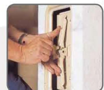
50 Izvadite sigurnosni osigurač.