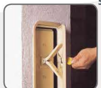
51 Pomoću priloženog ključa zatvorite vratašca za čišćenje.