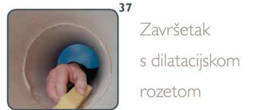
37 Očistite ostatak brtvene mase i kita.