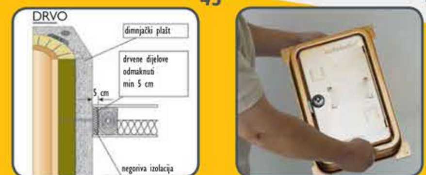
45 Izvadite krilo vratašca.