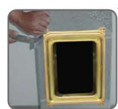
47 Okvir vratašca namjestite u izrezani otvor te ga pričvrstite na plašt priloženim čavličima.