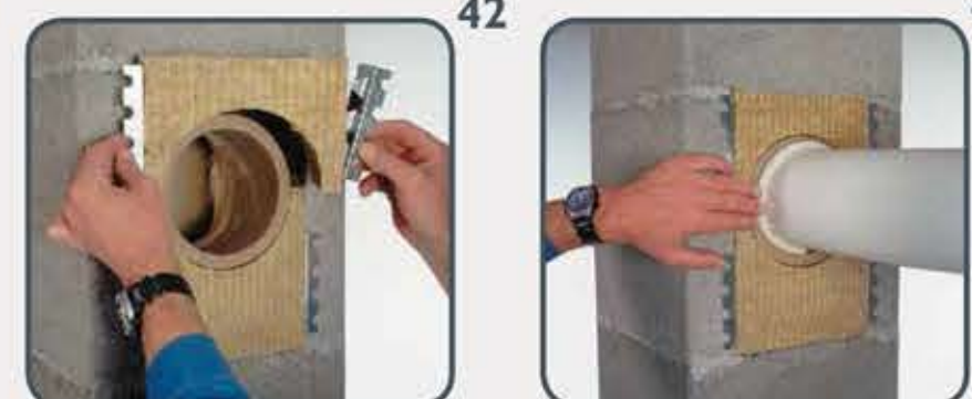
42 Ploče namjestite pomoću nosača terovla.