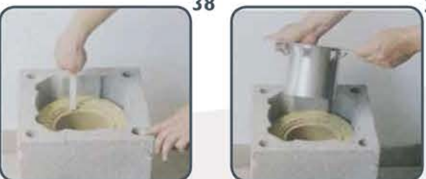
38 Izolacijska ploča i cijev kod zadnjeg plašta završavaju 10 cm od ruba plašta.