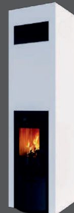
SCHIEDEL ELIPSE S EXCLUSIVE