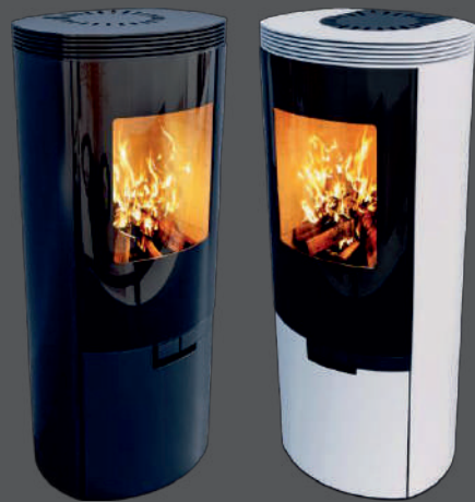
SCHIEDEL ELIPSE S