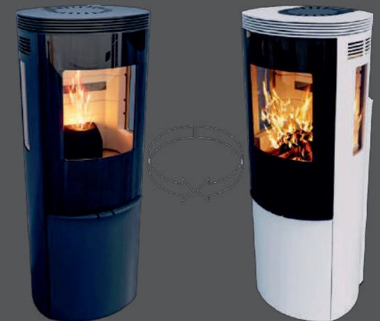
SCHIEDEL ELIPSE HYBRID