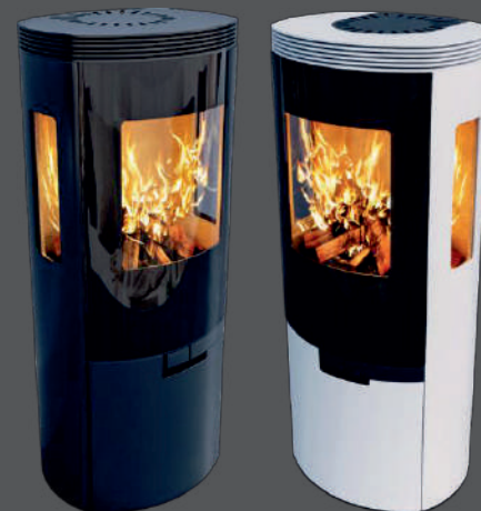
SCHIEDEL ELIPSE E